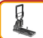
> Perfuradora 300 folhas