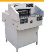
> Guilhotina Eléctrica Automática