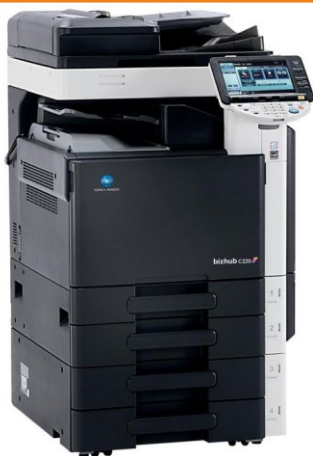
Copiadora / Impressora A3 Konica Minolta